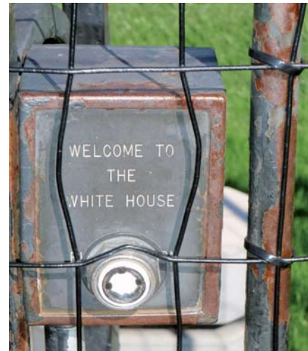
Ei ollut uusi isäntä vielä paikalla, eikä näkynyt vanhaakaan

Lisätietoja tämän vuoden tapahtumasta ja seminaareista löytyy Internetistä osoitteesta: www.emersonexchange.org .