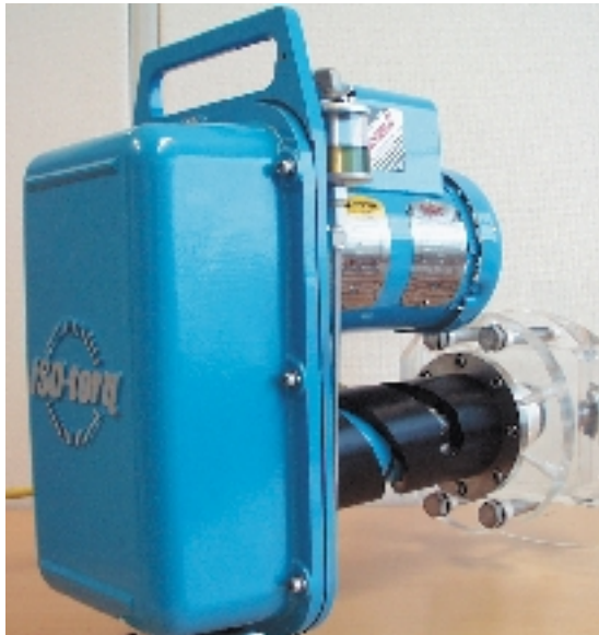
Esimerkki sakeustuotevalikoimastamme: ISO-torq, pyörivä sakeuslähetin

Olemme tehneet Kajaanin Prosessimittaukset Oy:n kanssa yhteistyösopimuksen, jonka ansiosta voimme jälleen tarjota sellu- ja paperiteollisuusasiakkaillemme kattavan ja kasvavan valikoiman sakeusmittalaitteita.